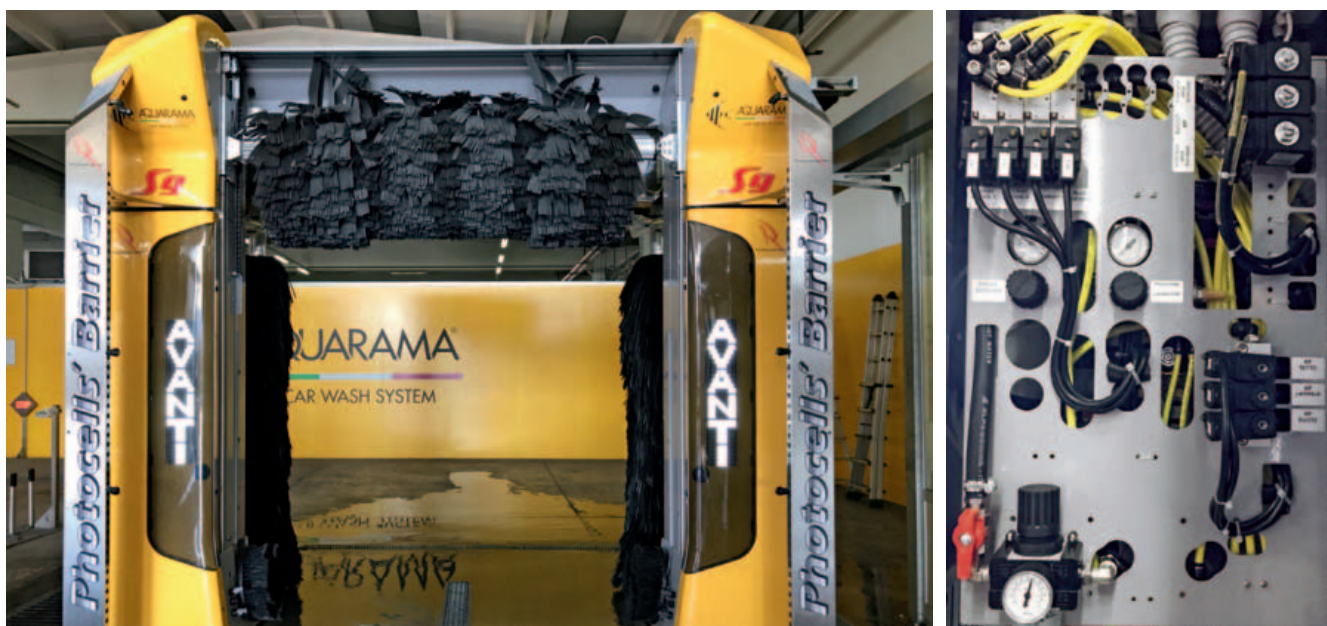
Le elettrovalvole di Aignep provvedono all'apertura e alla chiusura dei circuiti nella gestione dell'acqua impiegata.

reazione sotto effetto della dilatazione dovuta a caldo e freddo. Altra funzione svolta dai cilindri Aignep è quindi quella di dare la corretta inclinazione alla lama di asciugatura, affinché il getto d'aria